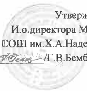
ГРАФИК родительского контроля за питанием обучающихся